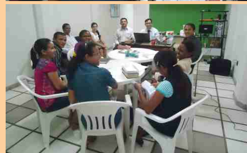
EQUIPES SEMADEMA e da Secretaria de Missões da AD em Timon, reunidos em São Luis.