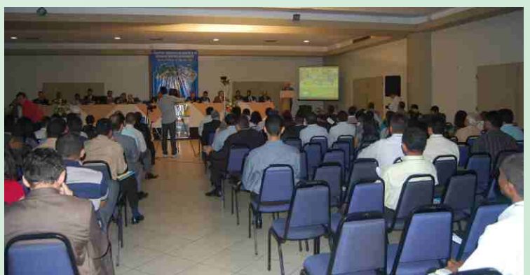
Foto plenário do fórum